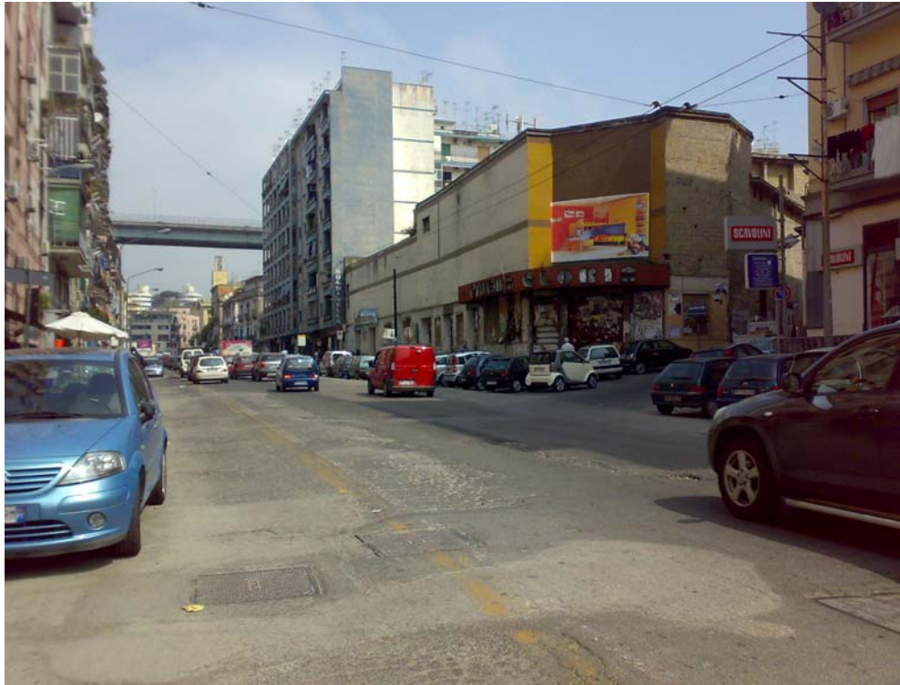
Via Arenaccia verso piazza ottocalli