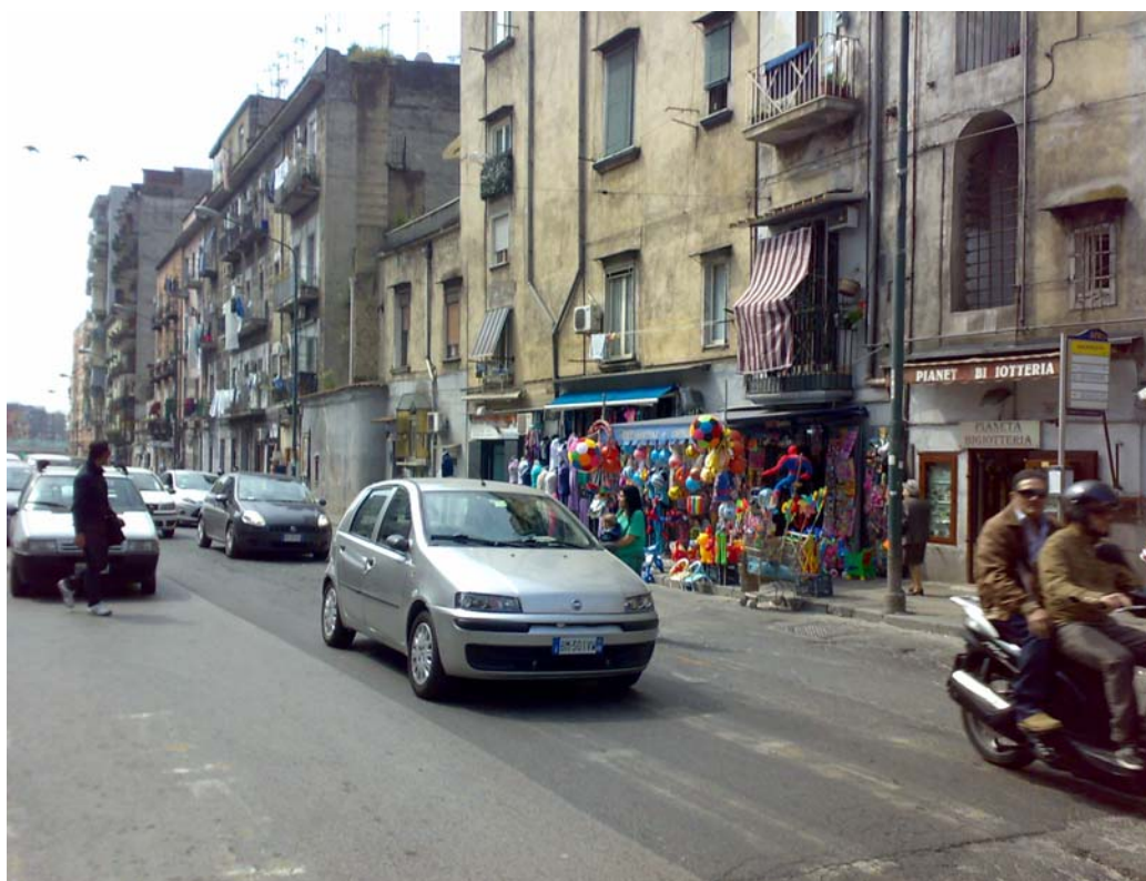
Via Arenaccia, verso via del Gussone